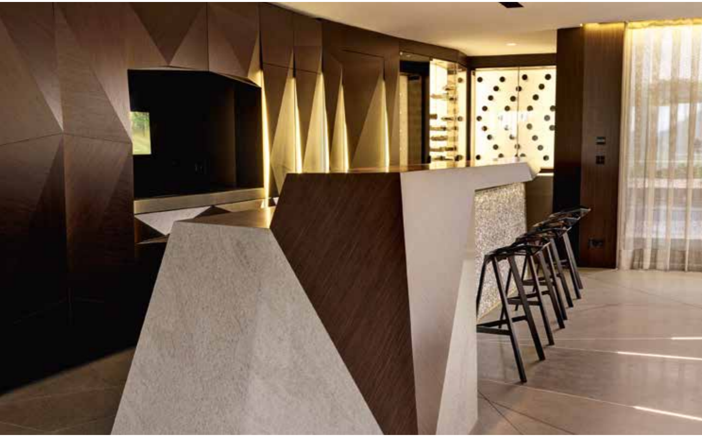
DIE GUTE STUBE – Natur und Hightech, Skulptur und Wohnraum, Offenheit und Privatsphäre: Selten hat ein Objekt das Spiel mit den Gegensätzen so souverän beherrscht wie dieses Bijou mit Namen Diamond.